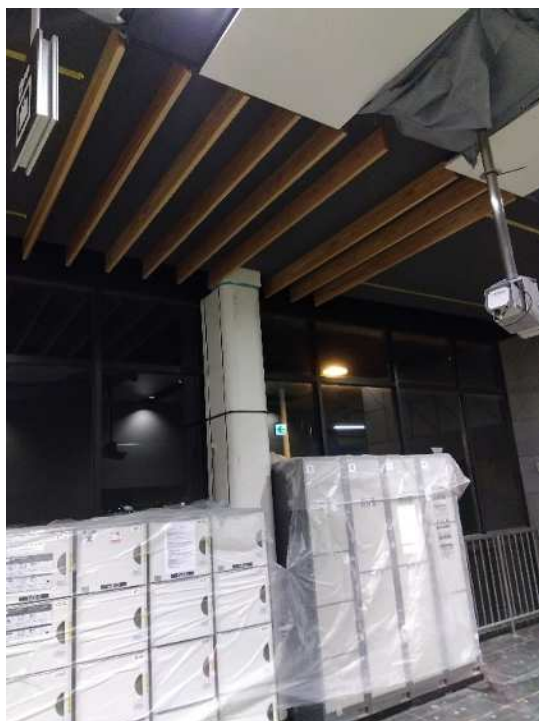
コンコース階 天井パネル 貼替え作業状況

構内通路の床タイル及び天井パネルの貼替え、既存エスカレーターの更新作業を行っています。