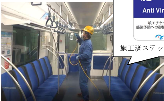
【抗ウイルス加工作業】