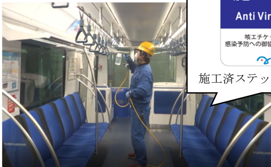
【抗ウイルス加工作業】