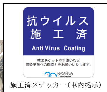
施工済ステッカー（車内掲示）