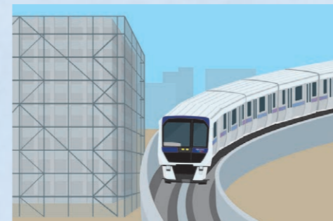
足場を使った作業