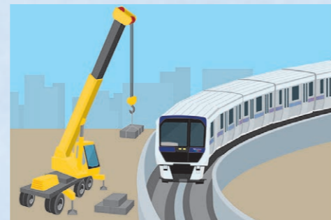
重機を使った作業